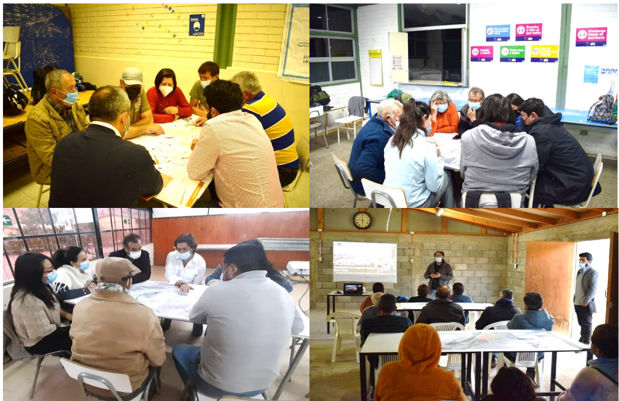
Fig. 2. Registro 2ª Jornada de Participación Ciudadana con presencia de pueblos originarios / PRC_MPatria