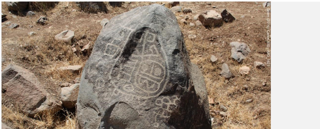
Fig. 6. Petroglifo en Huatulame

Como es posible apreciar, en dicha Imagen Objetivo Comunal se plasma la intención de considerar la visión de los pueblos originarios, en términos de preservar un modo de vida tradicional que es característico del territorio, y que se manifiesta en actividades como la agricultura campesina y la trashumancia. Por otra parte, se señala la voluntad de preservar la imagen identitaria de los poblados a través de la conservación del patrimonio arquitectónico y ambiental. En consecuencia, se hace referencia también a la preservación de la cultura poniendo en valor el patrimonio arqueológico que para la Comunidad reviste gran importancia, en un contexto paisajístico que define la identidad rural de la Comuna. Todos estos aspectos han sido trabajados con las personas identificadas con los pueblos originarios de la Comuna de Monte Patria, a través de los talleres participativos en cada etapa de desarrollo del Plan.