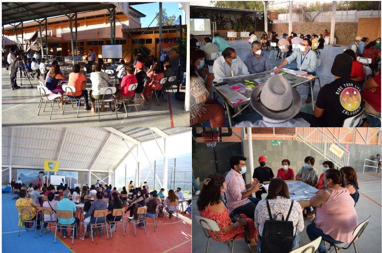
Fig. 1. Registro 1ª Jornada de Participación Ciudadana con presencia de pueblos originarios / PRC_MPatria

En este sentido, el trabajo específico con las personas de la Comuna de Monte Patria que se sienten representadas por un pueblo originario, se ha centrado principalmente en la componente de Identidad y Patrimonio, dando protagonismo a estos participantes a la hora de tratar este tema. La metodología de participación ha considerado una presentación introductoria sobre los alcances del proceso de actualización del PRC y un segundo momento de trabajo en mesas junto a la Comunidad, en las cuales las personas de pueblos originarios han podido plantear su visión sobre aspectos identitarios del territorio. En general se puede establecer que las temáticas que mayor preocupación generan en las personas de pueblos originarios se centran principalmente en la protección del patrimonio arqueológico presente en el entorno de las áreas urbanas, situación que se replica en las localidades de Monte Patria, El Palqui, Huatulame, Chañaral Alto, Mialqui, Carén, Tulahuén, Pedregal, Rapel y Las Mollacas; denotando gran densidad de petroglifos que representan un elemento identitario de gran valor para estas comunidades. En un segundo término de importancia se centra el cuidado del patrimonio arquitectónico singular (iglesias, estaciones de ferrocarril, etc.) y el patrimonio residencial vernacular, denotando otra preocupación de los pueblos originarios por preservar la imagen característica de los poblados.