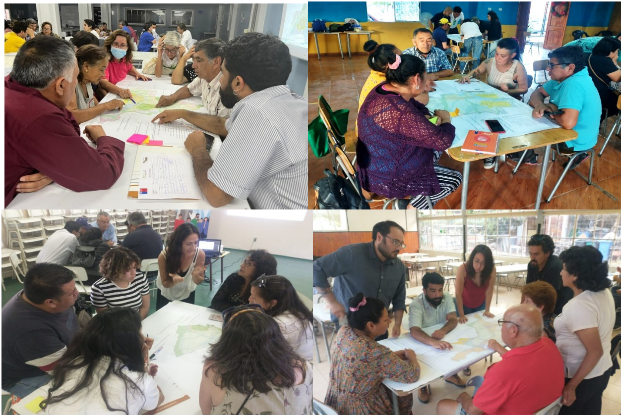
Fig. 4. Registro 3ª Jornada de Participación Ciudadana con presencia de pueblos originarios / PRC_MPatria